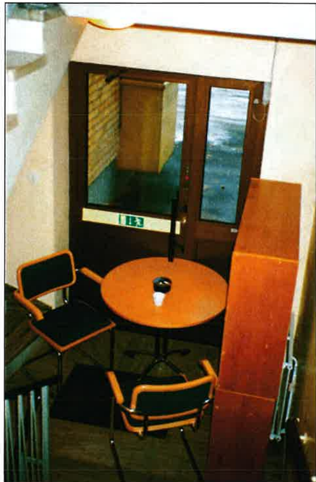
Så här får det inte se ut. Rökhörna i utrymningsväg.

Det är röken som dödar. Vid alla bränder utvecklas giftig rök. Brandröken innehåller många olika giftiga ämnen,