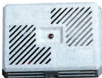
Brandvarnare är en billig livförsäkring.

En brandvarnare är en självklarhet i varje bostad. Brandvarnare räddar årligen många liv och är en av de billigaste livförsäkringar som du kan ha! De flesta dödsbränder inträffar under nattetid. Orsak är ofta sänggrökning, kvarglönt ljus eller elfel.