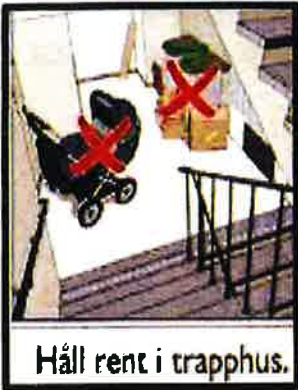
Håll rent i trapphus.