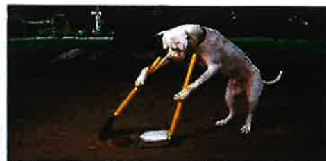
Fy husse! Vad har jag sagt till dig angående detta. Måst man gå omkring och plocka upp efter dig hela tiden.